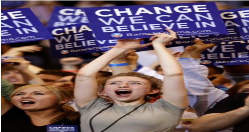
Obama, gen semene ulařmayı bařardı

Obama'nın "Deđiřim" sloganının mimarisi de Axelrod'tur. Bu slogan Obama aısından bir dezavantaj olarak karřısına ıkrsa bile seim kampanyasının kilit noktasını oluřturacaktı.