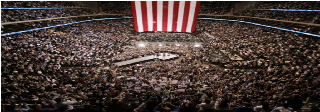
Başkan seçilen Barack Obama, Chicago Grand Park'ta halkla zafer sevincini paylaştı.

Kritik eyaletlerde, 1964'ten bu yana ilk kez Demokrat bir başkan adayının kazandığı görülmektedir. Virginia ve Colorado eyaletlerinde Barack Obama'nın oy oranı yaklaşık olarak yüzde 52 oldu. Ayrıca Florida, Ohio, Virginia ve Colorado Seçiciler Kurulu'na toplam 69 delege göndermektedir 17 .