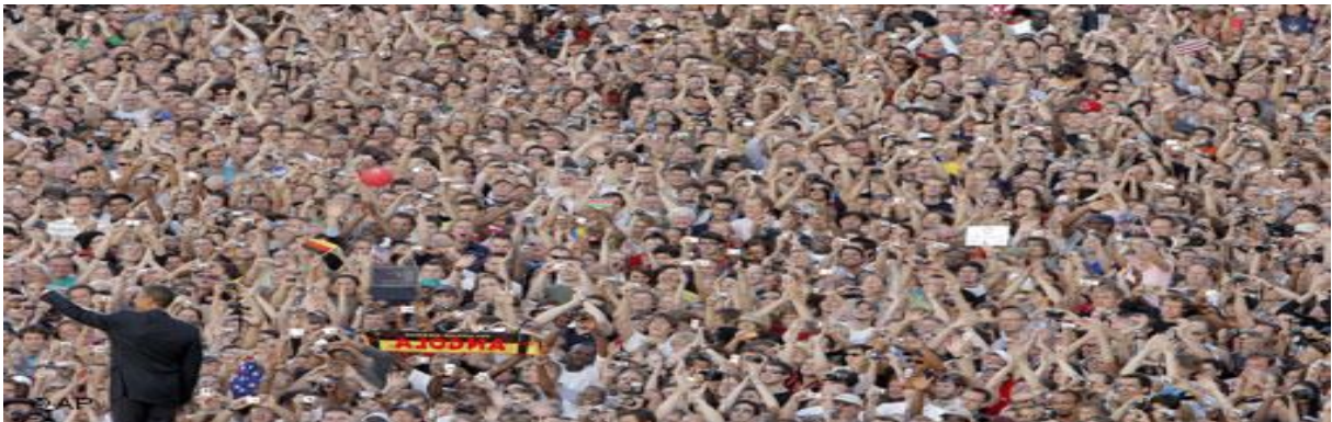
Barack Obama Berlin Zafer Anıt'ında halkla buluřtu